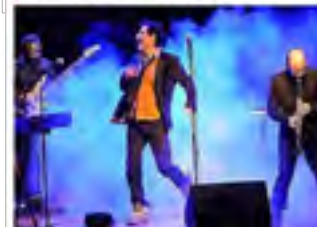
Le groupe yiddish, pop, et une touche d'ironie.

Le groupe montpelliérain présentera son "Casse-tête yiddish", le samedi 15 octobre