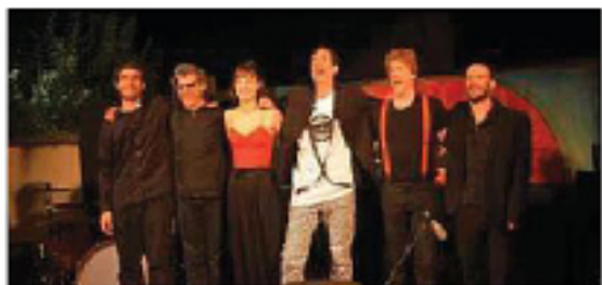
Bekar, un groupe qui marquera cette nouvelle édition du festival de la rue du Bizeou.

La 14 e édition du festival de la rue du Bizeou, à Arboucave, reçoit demain un groupe atypique et