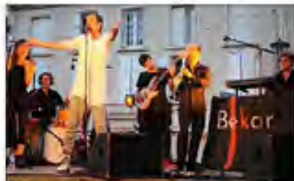
Bekar et ses compagnons de scène présentent des compositions aux arrangements très travaillés et dans une joyeuse complicité partagée avec le public.