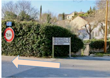
1) Rue des écoles (face au terrain de boules)