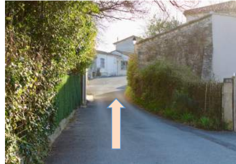
2) Rue des aires