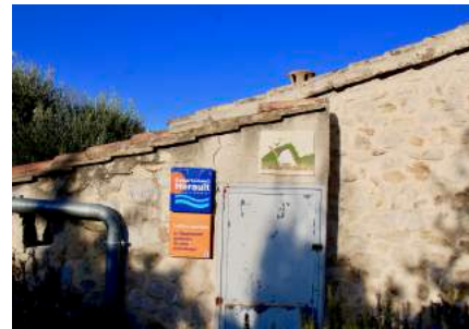
4) Nous y sommes...