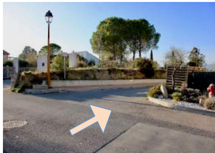
3) Rue de la Coste